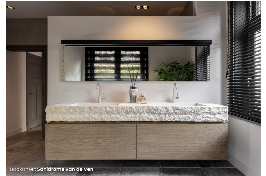
Badkamer: Sanidrome van de Ven