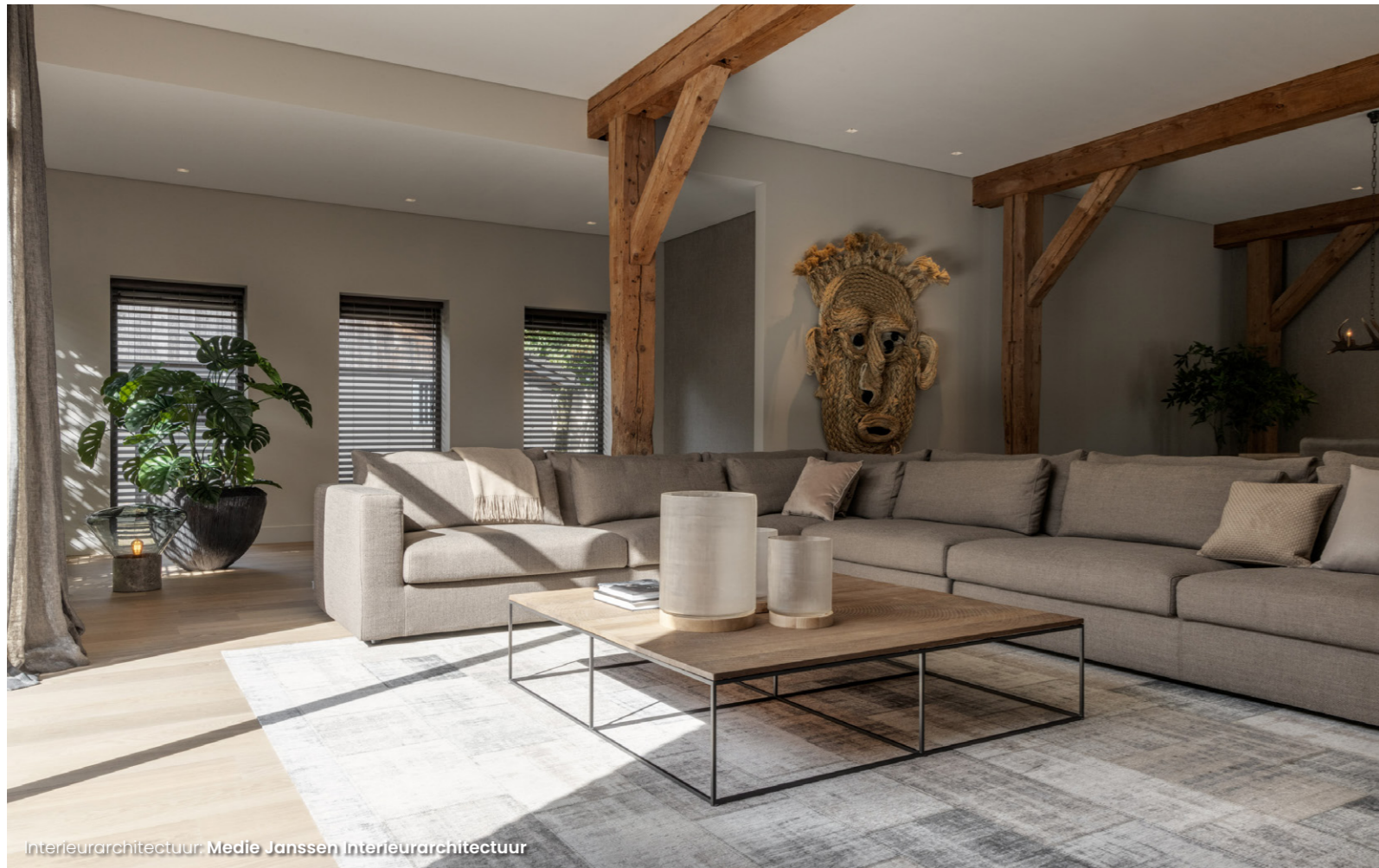
Interieurarchitectuur: Medie Janssen Interieurarchitectuur

De routing in dit huis en de functies van de verschillende ruimtes zijn totaal op de schop gegaan. Om aan de wens te voldoen om buiten met binnen te verbinden, deed Medie Janssen iets unieks: een aantal delen van het huis werden weer buitenruimte. “Deze boerderij heeft een grote U-vorm. We hebben één zijvleugel doorbroken en opgedeeld in een tv-kamer en een kantoor, de ruimte daartussen is nu open en vanuit de woonkamer kijk je erdoorheen naar de landerijen. We hebben ook een grote invloed gehad op de leefgedeeltes buitenshuis. Het hoveniersbedrijf heeft hier vervolgens goed op aangesloten met de beplanting.”