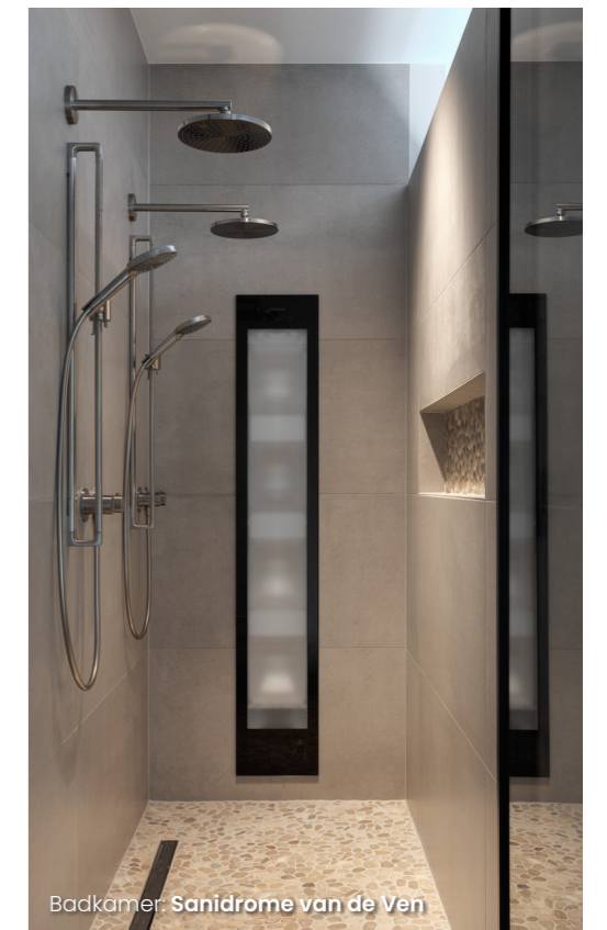
Badkamer: Sanidrome van de Ven