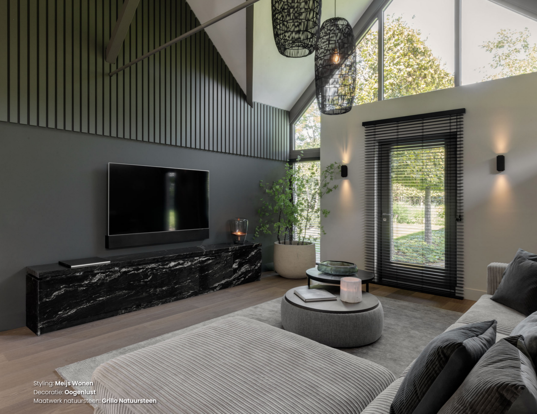
Styling: Meijs Wonen Decoratie: Oogenlust Maatwerk natuursteen: Grillo Natuursteen