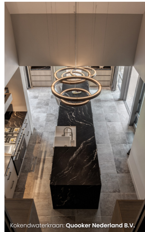
Kokendwaterkraan: Quooker Nederland B.V.