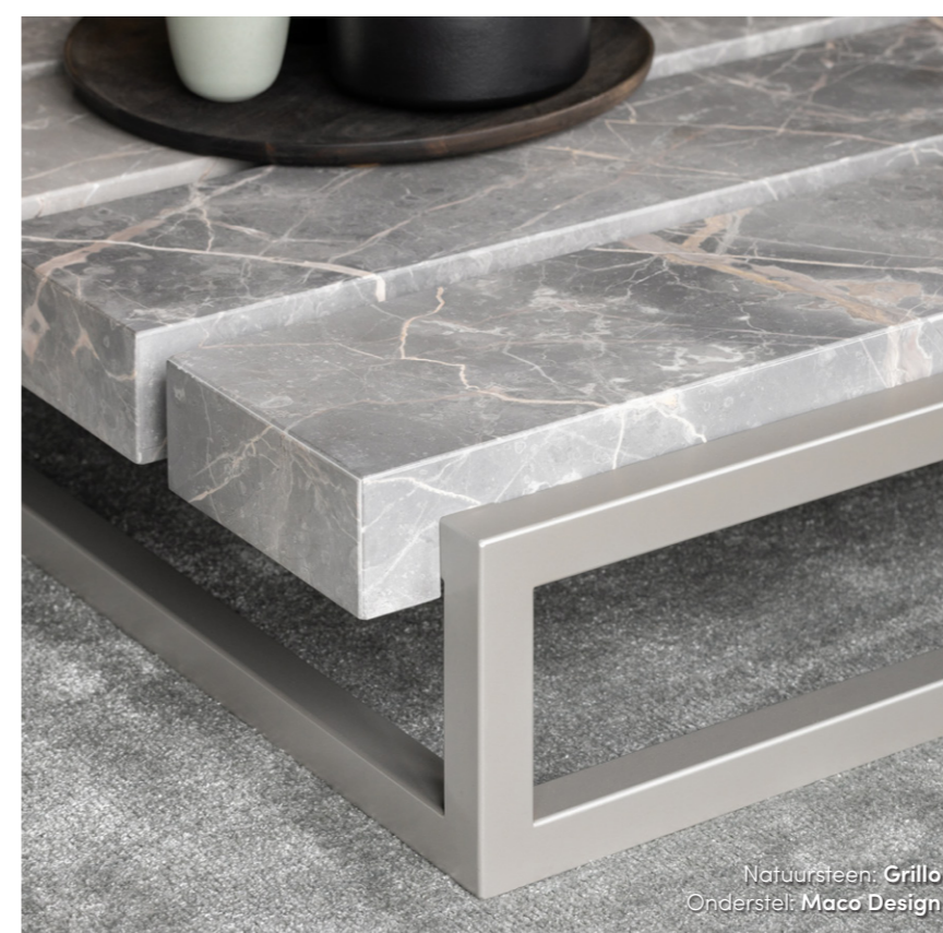
Natuursteen: Grillo Onderstel: Maco Design