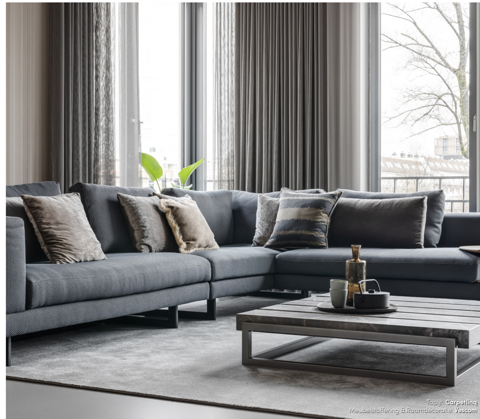
Tapijt: Carpetling Meubelstoffering & Raamdecoratie: Vescom