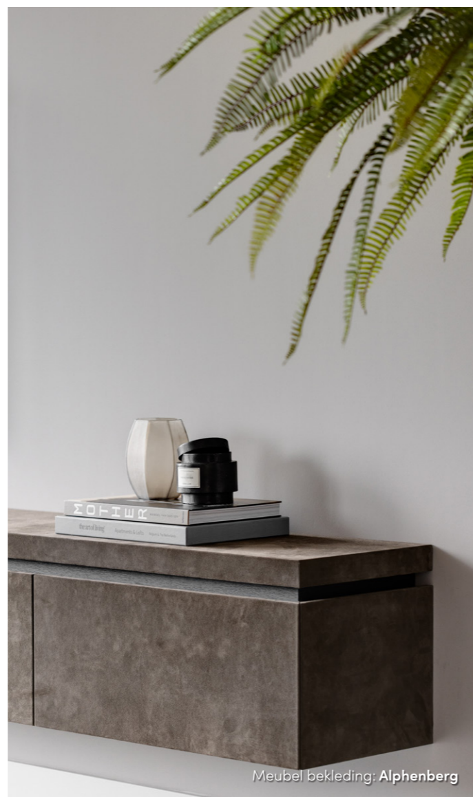
Meubel bekleding: Alphenberg

"Als er een vraag komt voor meubilair dat niet zomaar leverbaar is uit een collectie, dan ga je al gauw schetsen. Ik werk graag met authentieke materialen die zichzelf al bewezen hebben zoals natuursteen, leer en hout." Deze materialen zie je dan ook terug in het interieur van dit appartement.