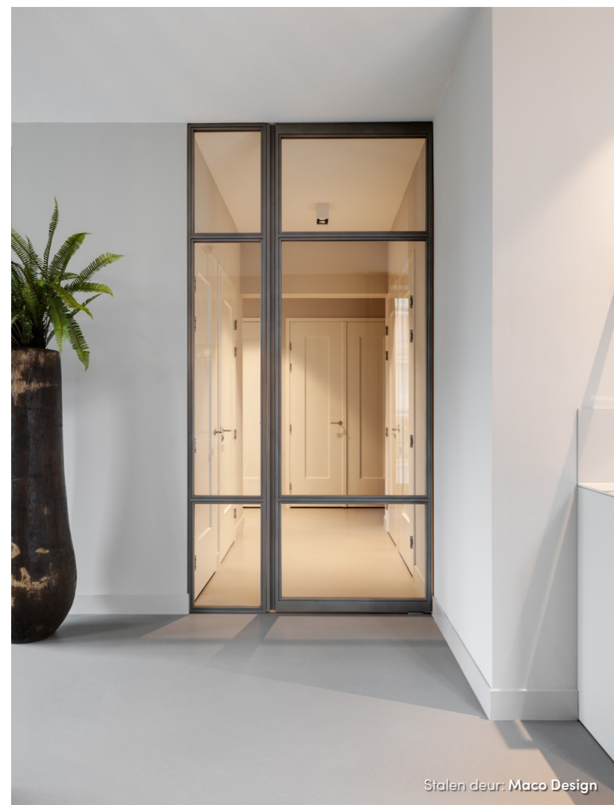
Stalen deur: Maco Design